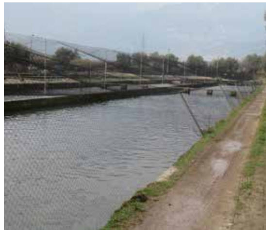
Fliesskanal in einer norditalienischen Forellenzucht

Mehr: fair-fish.net – Suche: Carefish/farm